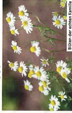
Blüten der echten Kamille

gebietsfremdes Kanadisches Berufkraut ( Erigeron canadensis ) oder heimisches Scharfes Berufkraut ( Erigeron acris ); beide haben jedoch kürzere Blütenblätter