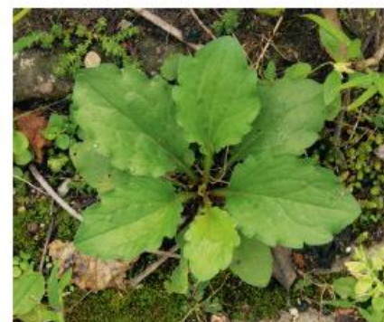
Jungpflanze bodennahe Rosette im ersten Jahr

ein-, zwei- oder bei Schnitt mehrjährige, bis 120 cm hohe krautige Pflanze, aufrechter, oben meist verzweigter, behaarter Stängel, bildet auf offenen Flächen dichte Bestände