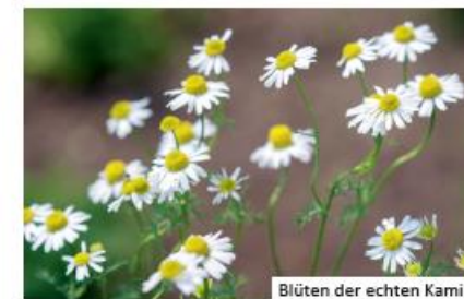
Blüten der echten Kamille

gebietsfremdes Kanadisches Berufkraut ( Erigeron canadensis ) oder heimisches Scharfes Berufkraut ( Erigeron acris ): beide haben jedoch kürzere Blütenblätter verschiedene Kamillen (Hundskamillen, Echte Kamille, Strandkamille): breite und weniger zahlreiche Blütenblätter sowie geteilte Blätter