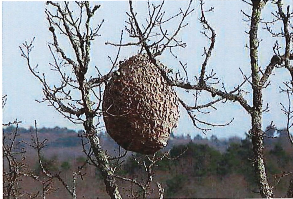
Abbildung 2: Nest in Baumkrone

Bitte melden Sie verdächtige Nester und Insekten (mit Bild und Koordinaten) an: