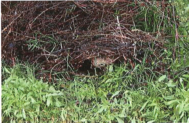
Abbildung 1: Vornest im Frühling http://www.hornissenschutz.ch/vespa-velutina-nth.htm